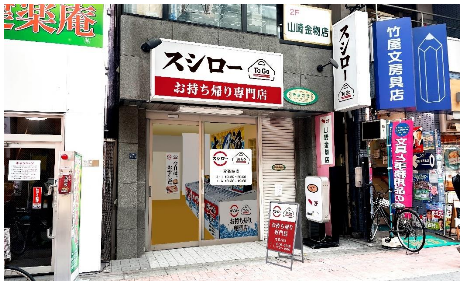
『スシロー To Go 大山ハッピーロード店』